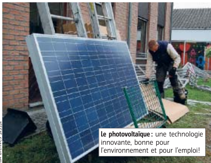
Le photovoltaïque : une technologie innovante, bonne pour l'environnement et pour l'emploi!

Si les emplois verts seront mis à l'honneur cette année, le Forem de Mons n'en oublie pas pour autant tous les autres secteurs d'activité. À Colfontaine, les demandeurs d'emploi, étudiants et travailleurs en quête d'un job pourront rencontrer 30 entreprises actives dans les secteurs de l'industrie, de la santé, des services financiers, de la vente, de la sécurité, des services aux personnes, etc. Avec la volonté de faire aussi bien qu'en 2009, année où le salon de Frameries avait accueilli plus de 1 500 candidats et une trentaine d'entreprises. Et avait permis à une dizaine de demandeurs d'emploi d'être engagés. ■