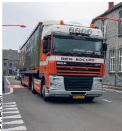
Le secteur du transport, notamment, recherche des travailleurs. Même non qualifiés.

« C'est l'avantage de ces industries. Pour la plupart, elles recherchent des personnes qualifiées mais également des employés non qualifiés qui travailleront à la chaîne par exemple. » Un signe encourageant pour ceux qui n'ont pas de grands diplômes à faire valoir.