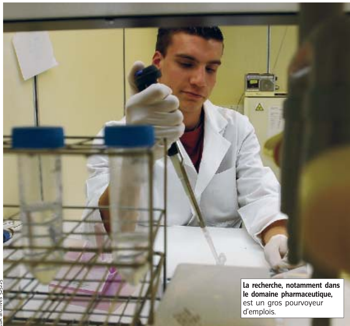
La recherche, notamment dans le domaine pharmaceutique, est un gros pourvoyeur d'emplois.

Au cours de ces dernières années, l'emploi total dans la chimie et la pharmacie n'a cessé de croître: une augmentation de 37 % entre 1996 et 2007 a d'ailleurs été observée. Soit 5 632 postes de travail supplé-