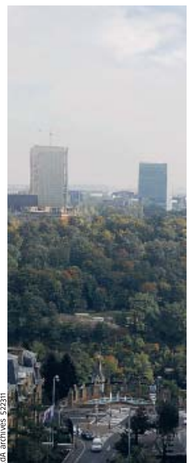
EdA archives 522311

Le Grand-Duché de Luxembourg attire un grand nombre de travailleurs belges.