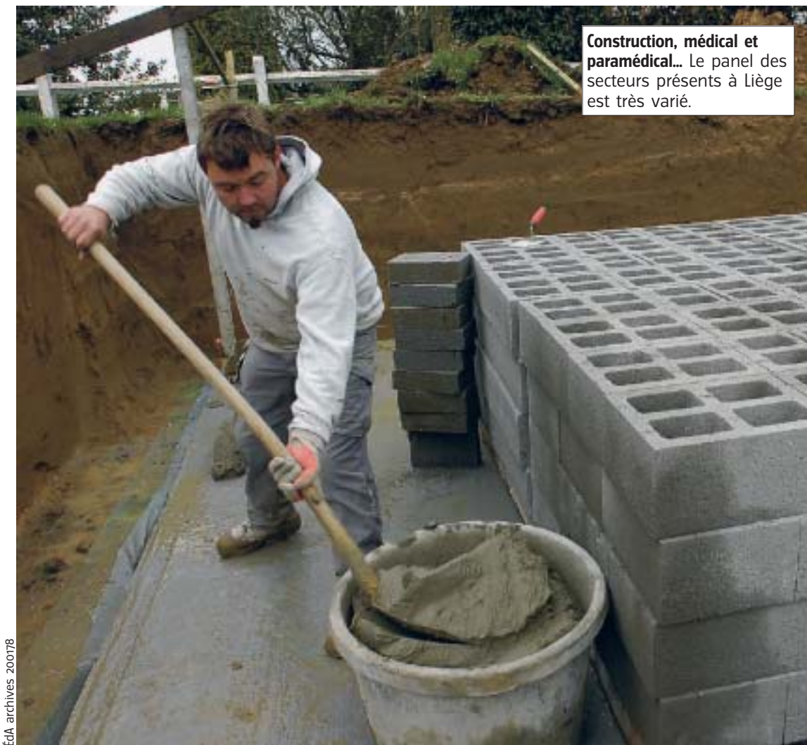
Construction, médical et paramédical... Le panel des secteurs présents à Liège est très varié.

Les entreprises de construction côtoieront donc les sociétés pharmaceutiques, les bureaux d'études, les agences d'intérim, les services à domicile et même la police ou... l'armée. « À Liège, nous avons la chance de nous trouver dans une région où