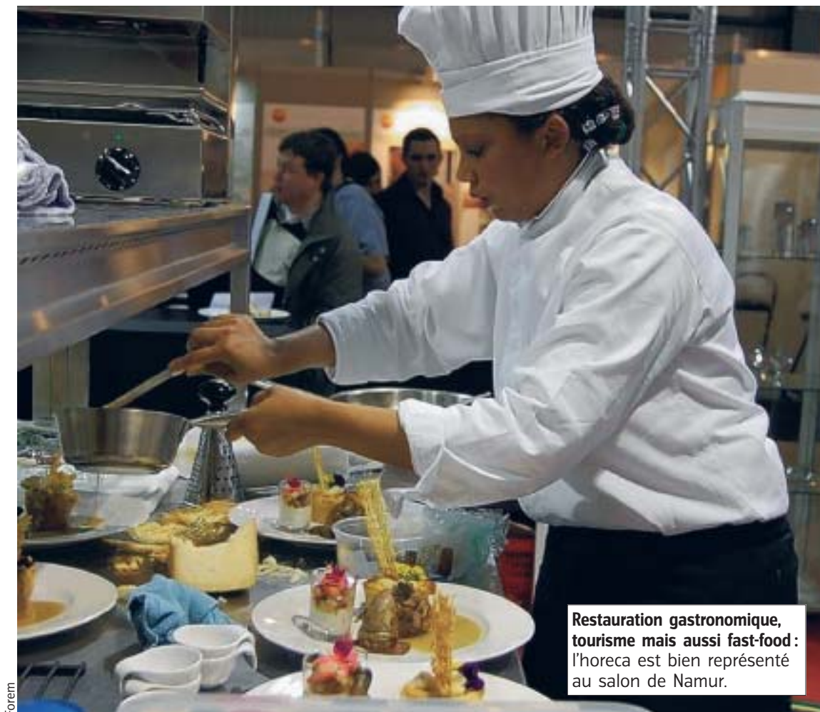
Restauration gastronomique, tourisme mais aussi fast-food: l'horeca est bien représenté au salon de Namur.

Si bon nombre de secteurs d'activité seront représentés, il en est un en particulier qui sera mis à l'honneur: l'horeca. Pour