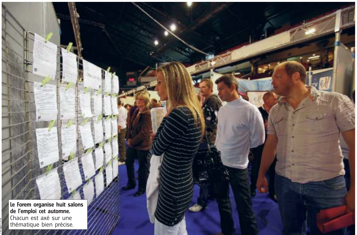
Le Forem organise huit salons de l'emploi cet automne. Chacun est axé sur une thématique bien précise.

Si la Wallonie se porte mieux, c'est en partie grâce au développement de plusieurs secteurs d'activité porteurs. « Même si certains champs d'activité ne sont plus en mesure d'embaucher, ce n'est pas le cas