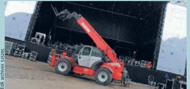
EdA archives 525295