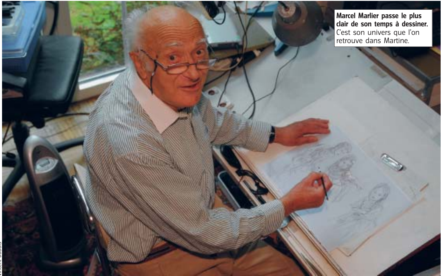
Marcel Marlier passe le plus clair de son temps à dessiner. C'est son univers que l'on retrouve dans Martine.

Mais travail n'est pas un terme approprié. Il y prend, c'est son mot, infiniment de plaisir. Du moins pour les esquisses, la création. La mise au net, minutieux exercice de finition qui lui prend deux ou trois jours par dessin, c'est, dit-il, «la barbe». Une énorme loupe surplombe la plan-