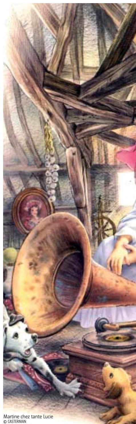
Martine chez tante Lucie © CASTERMAN

Le grand peintre espagnol Velazquez disait rechercher dans ses tableaux le « mystère d'entre les regards ». C'est cette recher-