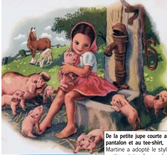
De la petite jupe courte au pantalon et au tee-shirt, Martine a adopté le style vestimentaire de son époque.

Ces dernières années, le dessinateur Marcel Marlier a permis à Martine d'enfiler des baskets et des jeans. À ses débuts, Martine était toujours en jupes, excepté pour son escapade au ski ( Martine à la montagne ). Martine s'est présentée pour la première fois en pantalon en 1977 lors de son voyage chez sa tante Lucie. À noter qu'on l'aperçoit déjà en pantalon dans Martine fait la cuisine lors de la cueillette des fraises.