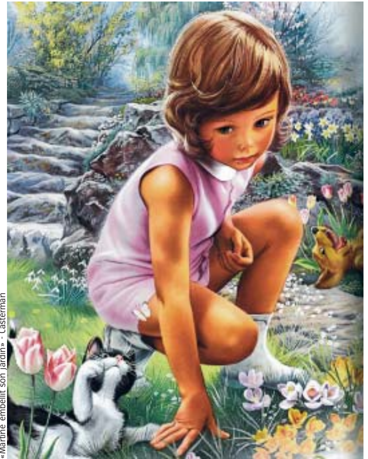
« Martine embellit son jardin » - Casterman