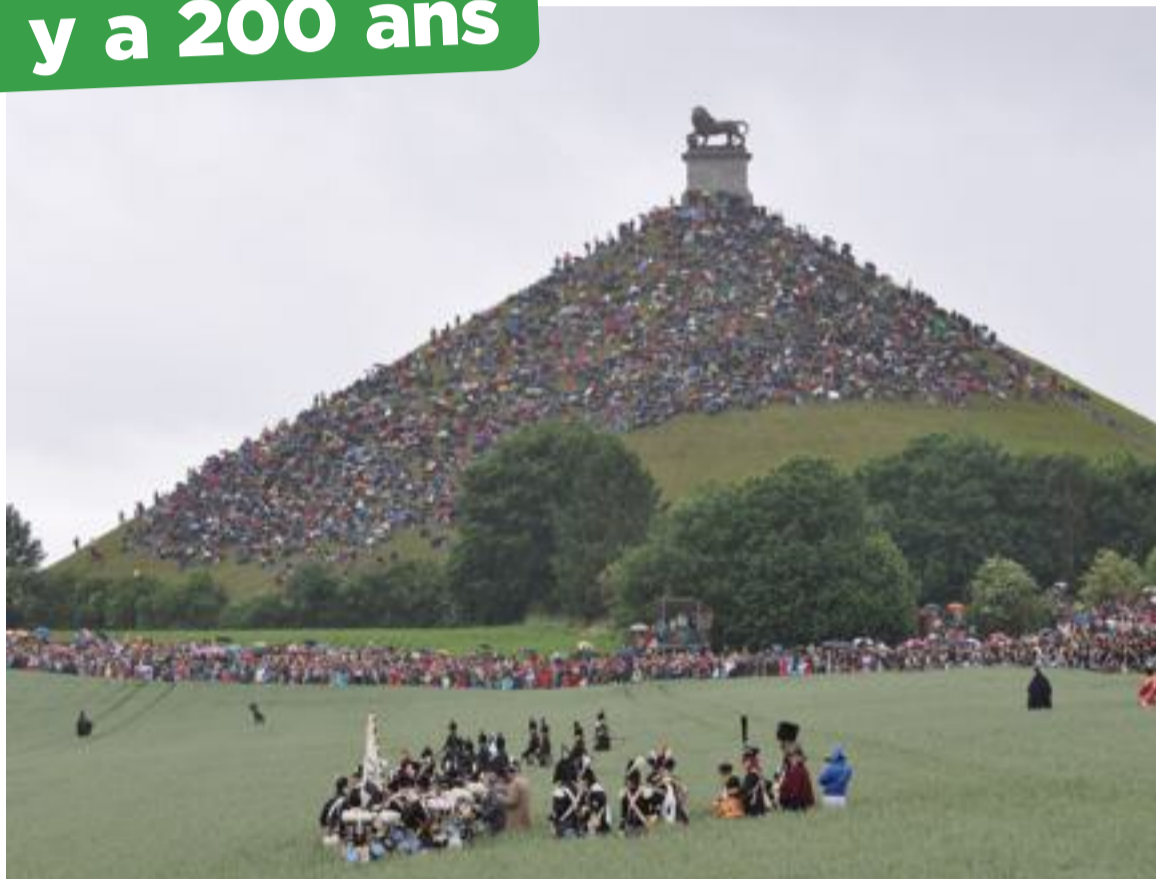
Des reconstitutions de la bataille de Waterloo ont lieu chaque année au pied de la Butte du Lion.

Du haut de la Butte du Lion, on a une large vue sur le site où l'empereur Napoléon a livré sa dernière bataille. Ce dossier vous emmène sur les traces du premier empereur des Français.