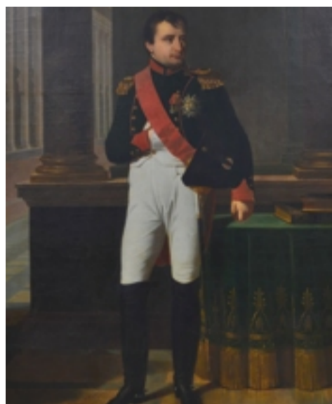
Ce portrait de Napoléon I er a été peint par le Français Robert Leffèvre.