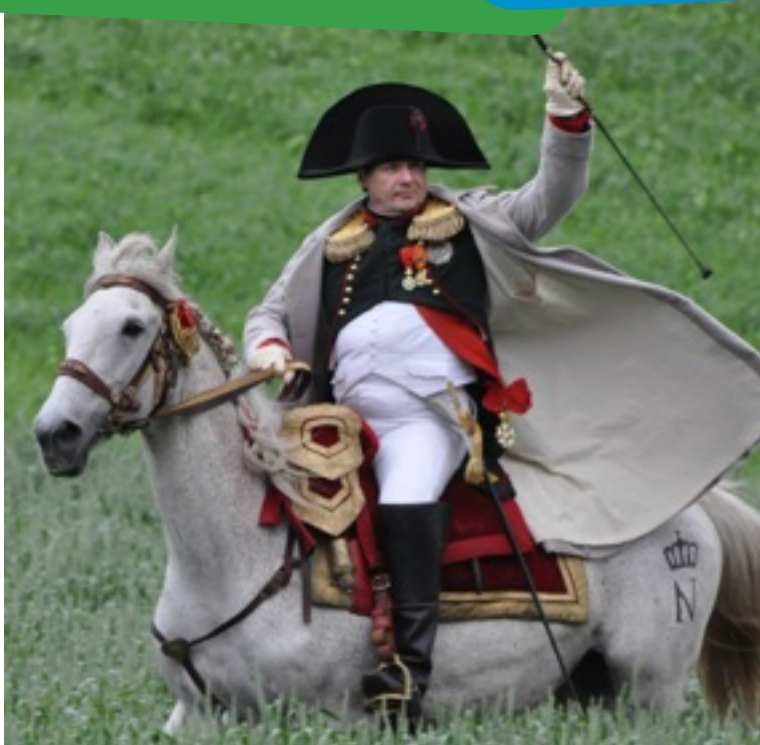
Éditions de l'Avenir/E. Guisgand

En même temps, il met en pratique certaines idées révolutionnaires qui donnent plus de libertés. Ainsi, il signe le Concordat en 1801 avec le Pape. Ce document reconnaît le catholicisme (une religion chrétienne) comme étant la religion de la grande majorité des Français. Les juifs et les protestants ob-