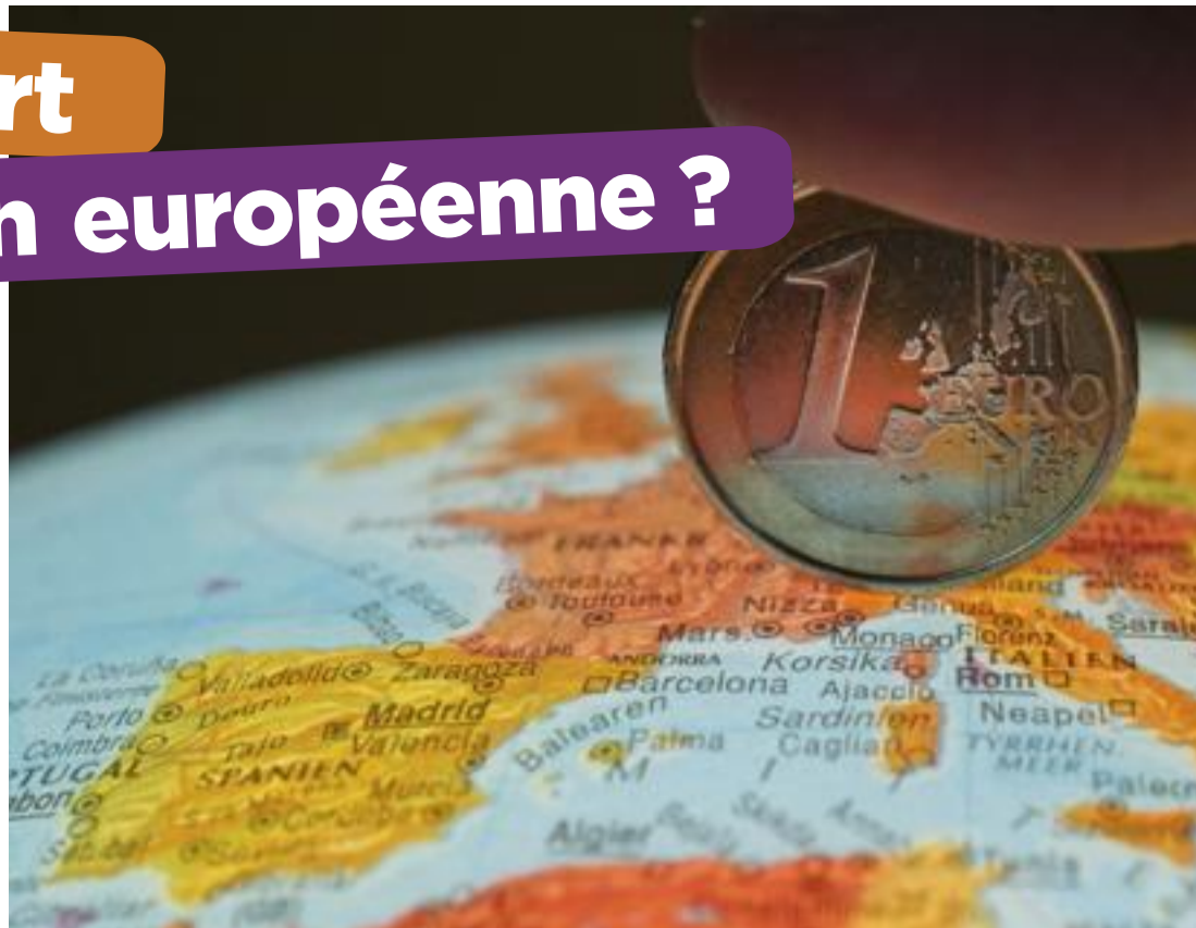
La réalisation la plus concrète de l'UE est sans doute la création d'une monnaie unique.

marque. Cela profite en principe aux consommateurs qui paient les marchandises moins cher. L'Union européenne surveille son grand marché pour protéger le consommateur contre la concurrence déloyale (pas honnête). Les entreprises