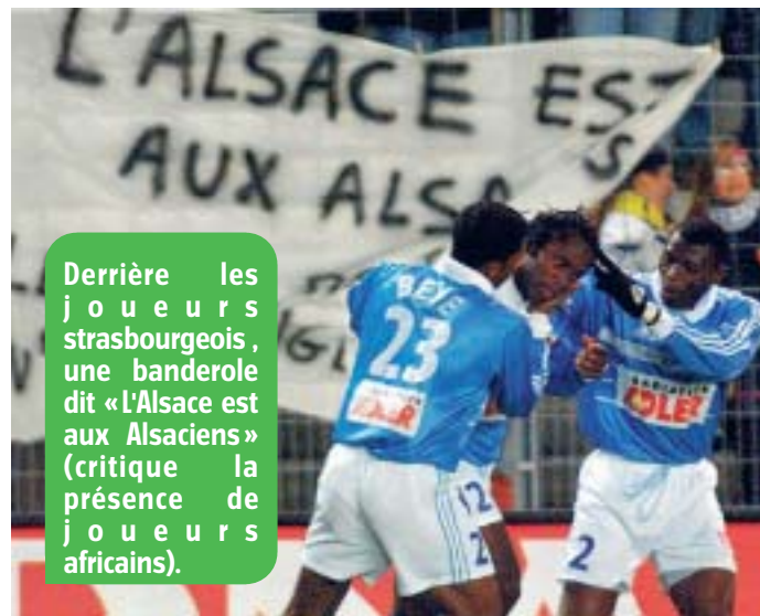
Derrière les joueurs strasbourgeois, une banderole dit «L'Alsace est aux Alsaciens» (critique la présence de joueurs africains).