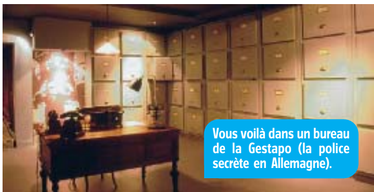
Vous voilà dans un bureau de la Gestapo (la police secrète en Allemagne).