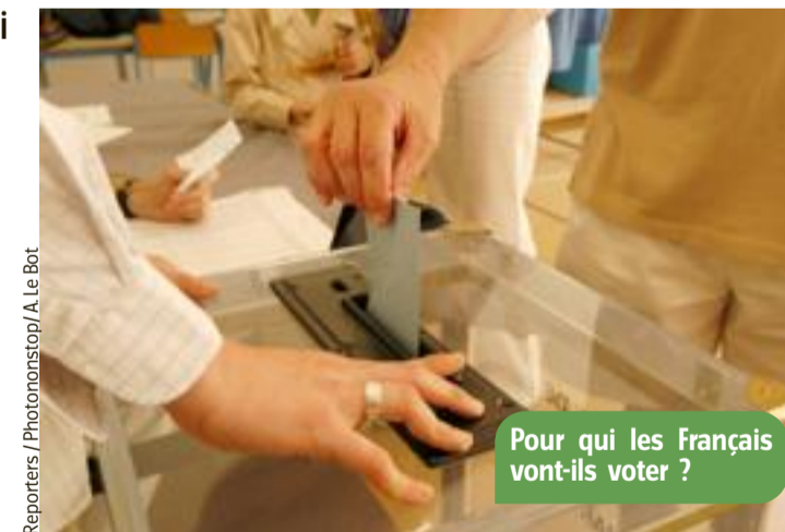
Pour qui les Français vont-ils voter ?

Les enquêteurs demandent à un échantillon (une petite partie) de la population française pour qui ils ont l'intention de voter. Ils interrogent des hommes et des femmes, des jeunes et des plus vieux, des gens qui habitent en ville et des campagnards, des gens qui ont fait beaucoup d'études et d'autres qui en ont fait moins, des travailleurs, des retraités... Suivant les réponses, des spécialistes calculent, pour cha-