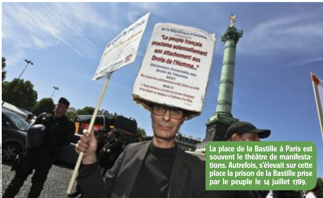
La place de la Bastille à Paris est souvent le théâtre de manifestations. Autrefois, s'élevait sur cette place la prison de la Bastille prise par le peuple le 14 juillet 1789.

Par la suite, la France va connaître plusieurs périodes appelées Républiques. Actuellement, on en est à la 5 e République. Elle a été instaurée (créée) en 1958. Chaque changement de république correspond à des modifications de l'organisation du pays et à des changements de Constitution. Vive la République ! Vive le président !