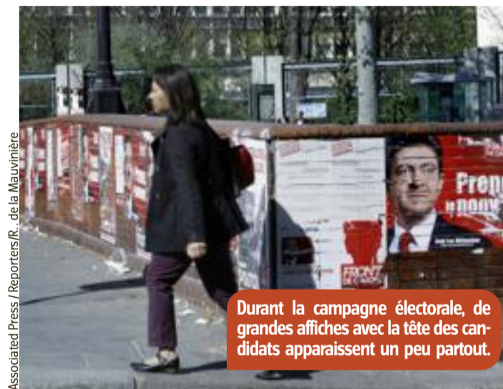
Durant la campagne électorale, de grandes affiches avec la tête des candidats apparaissent un peu partout.

Au cours de la campagne, les candidats réagissent aux idées des autres. C'est parfois drôle, parfois agressif (violent). Il se crée ainsi une sorte de débat entre les différents candidats