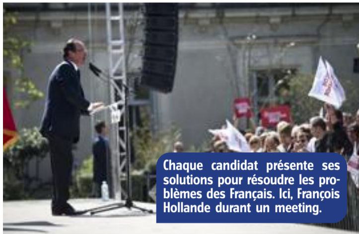
Chaque candidat présente ses solutions pour résoudre les problèmes des Français. Ici, François Hollande durant un meeting.

Quels sont les thèmes (sujets) forts de la campagne présidentielle ?