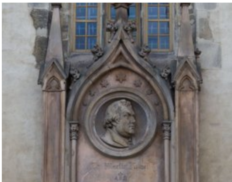
Sur ce monument, on distingue l'Allemand Martin Luther, un chrétien qui a contribué à la naissance du protestantisme.

L'Église chrétienne orthodoxe d'Orient s'est séparée de l'Église catholique de Rome en 1054. Cette Église se compose de plusieurs Églises (communautés) indépendantes les unes des autres. Elles sont surtout répandues dans les pays de l'est de l'Europe (Grèce, Russie, Bulgarie, Roumanie, Serbie...). Les orthodoxes s'opposent aux catholiques sur quelques dogmes (des points essentiels de croyances considérés comme des vérités qu'on ne peut contester). Ils rejettent l'autorité du pape. Les Églises orthodoxes sont dirigées par un patriarche. Les cérémonies religieuses, très longues, comportent des chants, des prières devant des