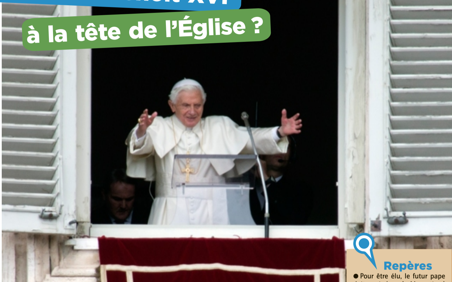
Près de 100 000 personnes étaient rassemblées place Saint-Pierre à Rome le 24 février pour assister à la dernière bénédiction du pape Benoît XVI.

catholique, qui rassemble une partie des chrétiens (personnes qui croient que Jésus est le fils de Dieu) du monde entier.