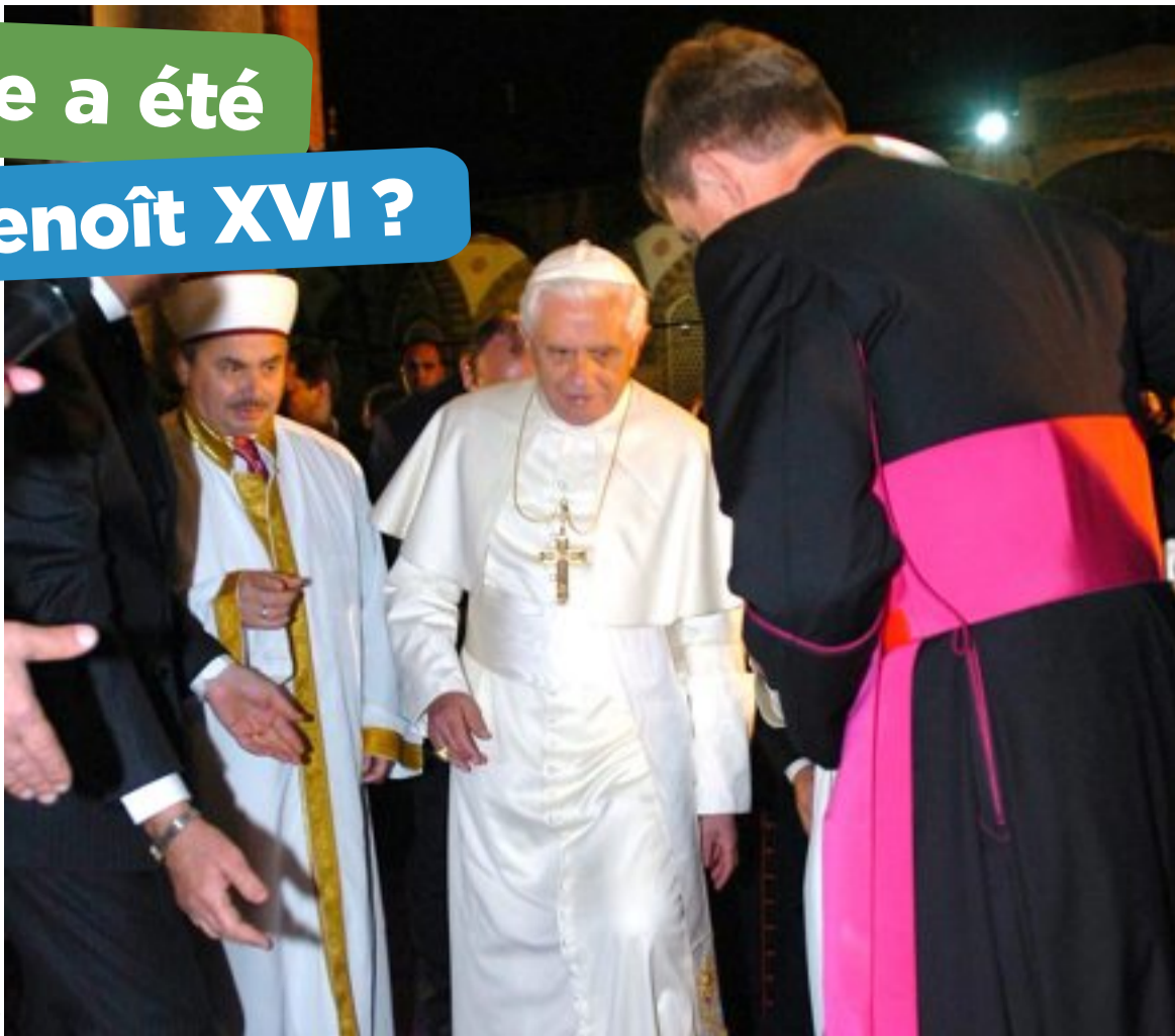
Le pape Benoît XVI en visite à la mosquée Bleue à Istanbul (Turquie) en 2006.

Lorsqu'il succède à Jean-Paul II, certains catholiques le trouvent trop conservateur, c'est-à-dire très attaché à respecter les règles de l'Église et les textes de la Bible de façon stricte (sévère). Les conservateurs craignent les changements. Tout comme le pape Jean-Paul II avant lui, Benoît XVI s'oppose à ce que les divorcés