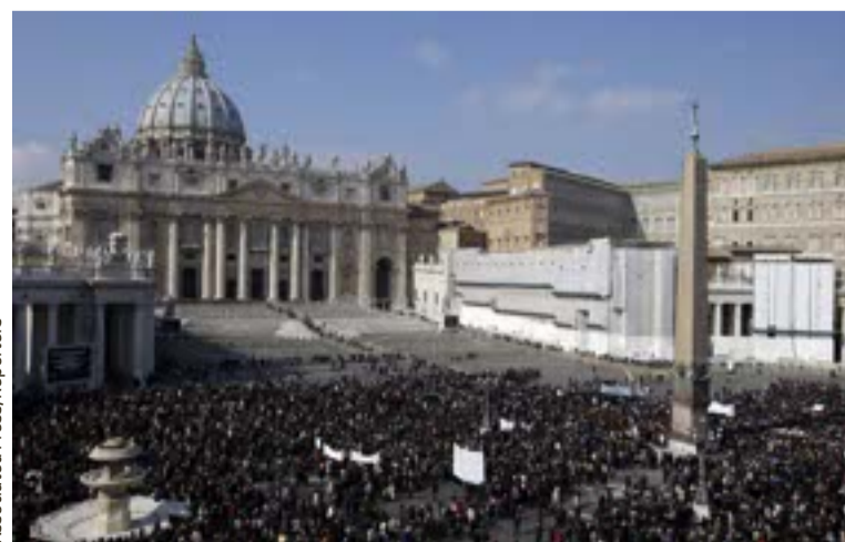
La place Saint-Pierre au Vatican. On aperçoit le dôme (toit arrondi) de la basilique Saint-Pierre.