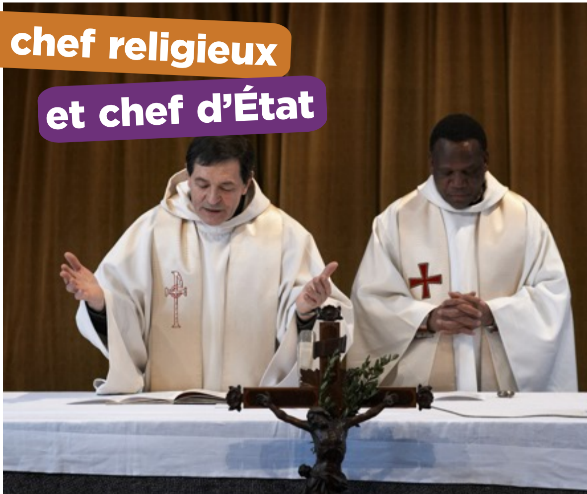
Les prêtres expliquent la parole de Dieu et administrent les sacrements.

Les prêtres forment ce que l'on appelle le clergé (ensemble des personnes qui consacrent leur vie à Dieu) séculier (du mot « siècle »). Cela signifie qu'ils vivent dans leur temps, qu'ils travaillent parmi les habitants d'un quartier, d'un village, d'une ville... Ils doivent rester célibataires (ne peuvent pas se marier). Ils peuvent être aidés par des diacres, des hommes et des femmes laïques (non religieux) qui eux, peuvent être