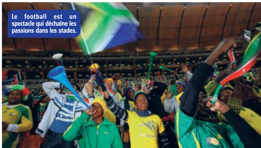
Le football est un spectacle qui déchaîne les passions dans les stades.

● Foot et fric Le Mondial, ce n'est pas que la grande fête du sport. C'est aussi un événement qui rap-