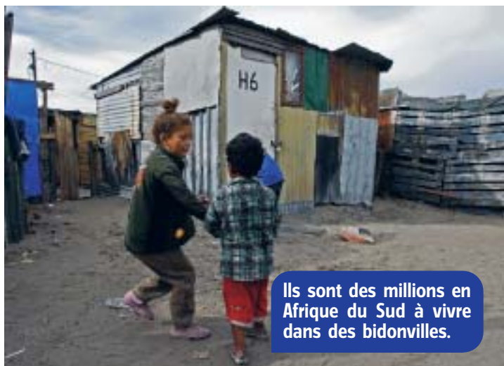
Ils sont des millions en Afrique du Sud à vivre dans des bidonvilles.

Des milliers de gens meurent chaque année du sida. À cause de cette maladie, on estime (pense) que 2 millions d'enfants sont orphelins dans le pays. Durant des années, les autorités n'ont pas vraiment agi pour éviter que la maladie se propage (se répande). Le président actuel, Jacob Zuma, a décidé d'agir mais il faudra du temps avant de voir reculer la maladie.