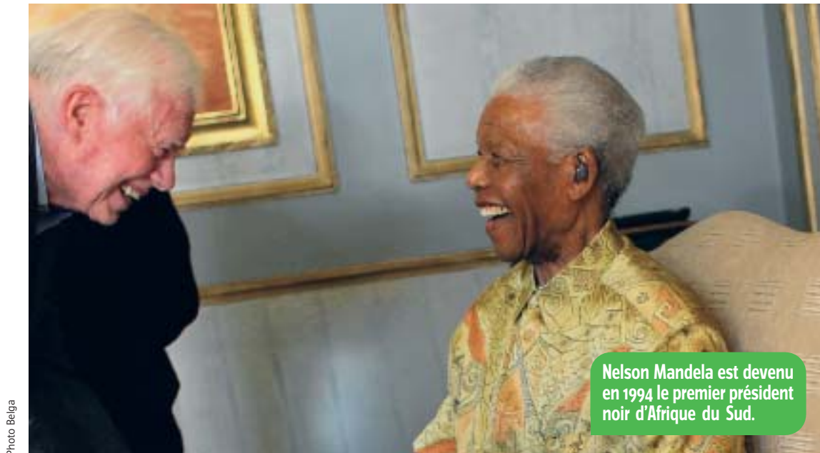
Nelson Mandela est devenu en 1994 le premier président noir d'Afrique du Sud.

Il y a 4 groupes d'habitants en Afrique du Sud : les Blancs (4 millions en 1948), les Noirs (20 millions), les Métis (2,5 millions), les Indiens (750 000). L'apartheid est un système qui sépare les habitants du pays en 4 groupes (Blancs, Noirs, Métis et Indiens) et place les Blancs au-dessus des autres. Tout contact entre ces populations est interdit. Les différents groupes doivent habiter dans des zones définies pour eux et séparées les uns des autres. En gros, les Blancs occupent les beaux quartiers des villes, les Noirs vivent dans des bidonvilles (quartiers très pauvres faits de baraques). La minorité des Blancs s'attribue aussi 87 % des terres, les plus riches. Sur les 13 % restants, les Blancs créent d'autorité des États noirs soi-disant indépendants, appelés bantoustans. Trois millions et demi de Noirs vont être obligés de rejoindre ces territoires réservés pour eux. Les emplois (travaux) bien payés