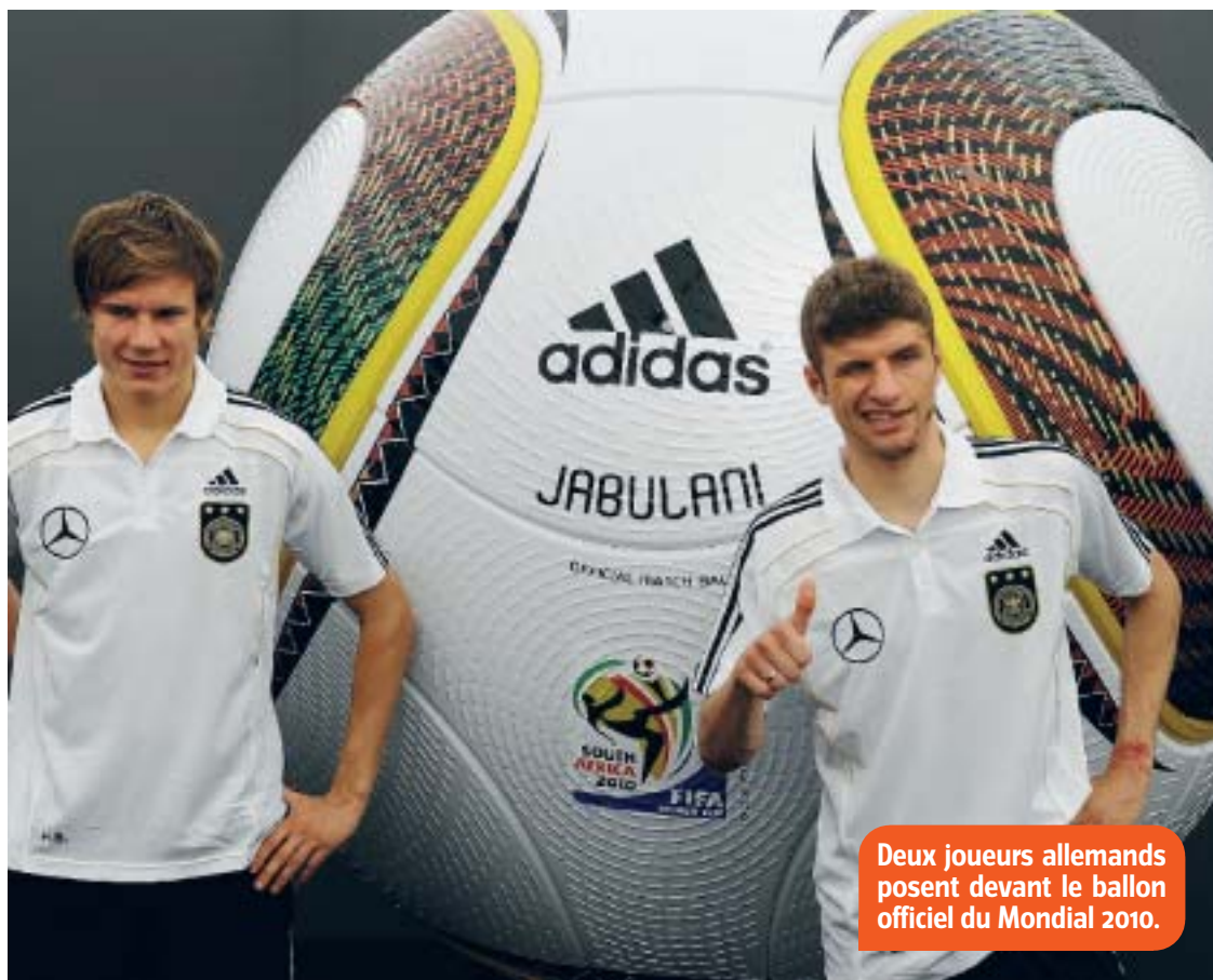
Deux joueurs allemands posent devant le ballon officiel du Mondial 2010.

● Sans la Belgique Cette année, la Belgique est à nouveau absente du Mondial. Notre équipe nationale, les Diables rouges, n'avait pas réussi à se qualifier non plus pour La Coupe du Monde 2006 en Allemagne. Depuis 1930, notre pays y a participé à 11 reprises. On espère que la Belgique fera partie des 32 nations qui disputeront la Coupe du Monde en 2014 au Brésil. En attendant, on peut toujours choisir une autre nation à supporter, histoire de se mettre dans la peau d'un vrai supporter.