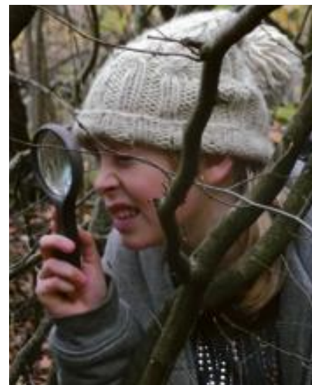
Les enfants peuvent porter un regard différent sur la nature.

Les élèves de Mme Coppée viennent de rentrer à l'école, pour la plupart couverts de boue. Ils croisent d'autres élèves en traversant la cour de récré. Un grand sourire aux lèvres, ils racontent à leurs camarades leur sortie en forêt. Une fierté!