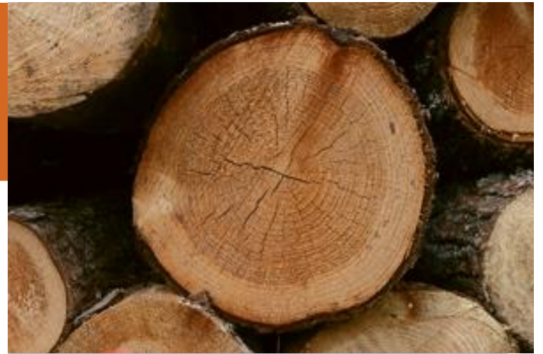
Les arbres coupés peuvent être utilisés pour faire entre autres du papier, du carton, du bois de chauffage.

l'air et du sol. Voilà pourquoi il est essentiel de remplacer un arbre par un autre. Chaque forêt est composée d'arbres d'âge différent car les forêts sont reboisées (plantées de nouveaux arbres) régulièrement. L'homme gère donc les forêts pour que les arbres aient assez d'espace et de lumière pour se développer (grandir) convenablement. Les arbres en fin de croissance seront coupés pour leur bois. Une fois abattu, un autre arbre sera replanté pour le remplacer. S'occuper d'une forêt demande donc de la patience. Il faudra par exemple 80 ans pour qu'un épicéa soit prêt à être coupé mais 150