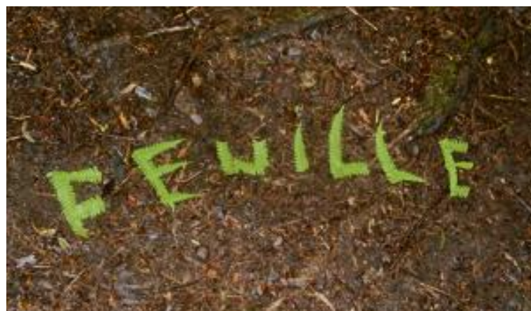
Chaque matière peut être enseignée de façon originale en forêt. Ici : l'orthographe.