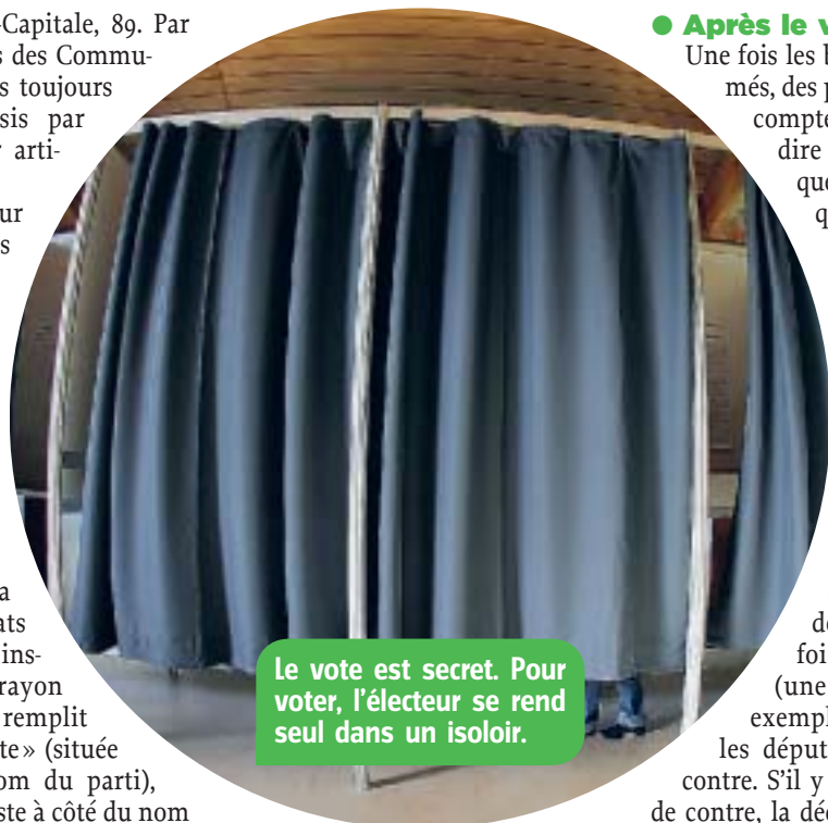
Le vote est secret. Pour voter, l'électeur se rend seul dans un isoloir.

Le papier et le crayon intriguent les élèves du futur. Certains en ont déjà vu dans les musées, mais en fait il y a longtemps que le papier a été abandonné. Il fallait couper beau-