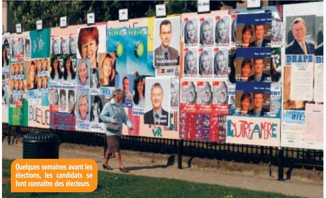
Quelques semaines avant les élections, les candidats se font connaître des électeurs.

Dans chaque bureau de vote, il y a un président, un secrétaire et des assesseurs (assistants). Ils sont là pour accueillir les électeurs et veiller à ce que le vote se déroule bien. Ils vérifient les cartes d'identité, cochent les listes des électeurs qui ont voté. Les électeurs votent pour élire directement des députés aux Régions qui seront chargés d'établir des règles, de voter des lois sur leur territoire. Le Conseil régional wallon compte 75 députés, le Conseil régional flamand en réunit 124 et celui de la ré-