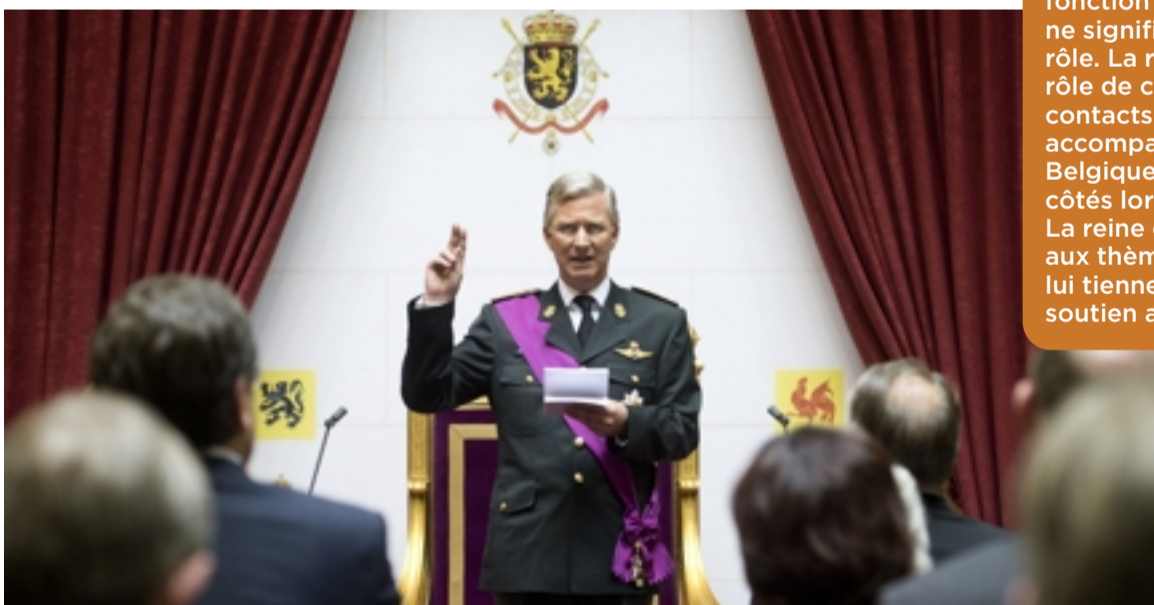
En prêtant serment devant les élus au Parlement, Philippe devient le 7 e roi des Belges.

Avant de pouvoir exercer ses fonctions, la Constitution prévoit que le roi doit prêter serment devant les élus du pays. Il prononce la phrase suivante : « Je jure d'observer la Constitution et les lois du peuple belge, de maintenir l'indépendance nationale et l'intégrité du territoire. » Cela signifie que le roi promet de régner en respectant la Constitution et les lois. Il promet aussi de défendre l'indépendance (la liberté) et le territoire du pays.