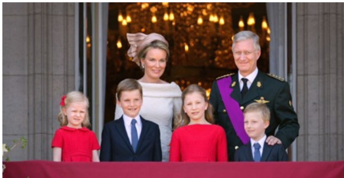
Le roi Philippe, la reine Mathilde et leurs 4 enfants.

L e 7 e roi des Belges, Philippe, est né le 15 avril 1960. Il est le fils aîné du roi Albert II et de la reine Paola. Il a une sœur, la princesse Astrid, et un frère, le prince Laurent. Après ses études secondaires, le