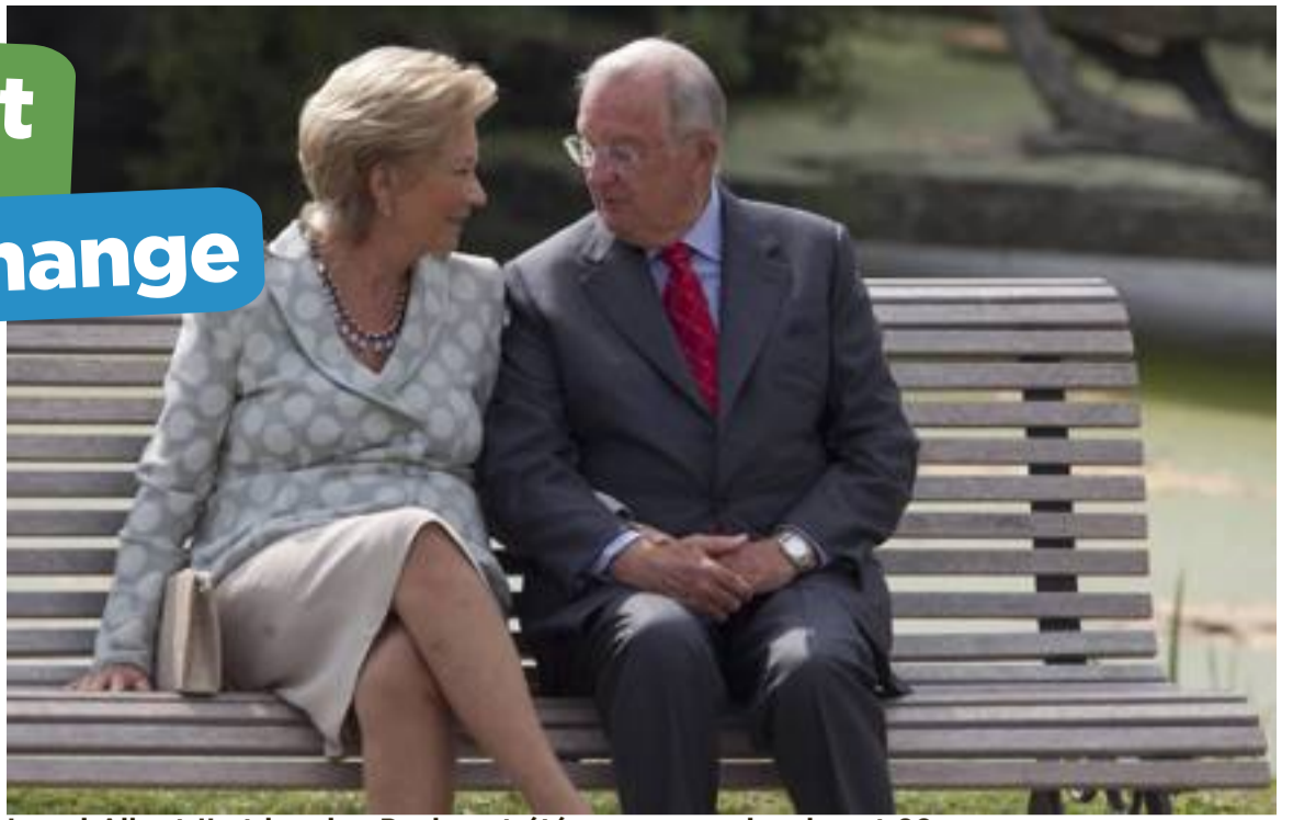
Le roi Albert II et la reine Paola ont été nos souverains durant 20 ans.

tes parties qui composent le pays) mais Flamands et Wallons ont du mal à s'entendre sur les changements dans le fonctionnement du pays. Ainsi, après les élections législatives (le peuple vote pour choisir ses représentants au Parlement) en 2010, les tensions entre les deux communautés provoquent une crise longue de 541 jours. Durant cette période, les élus ne parvenaient pas à se mettre d'accord pour former un nouveau gouvernement. Comme le prévoit la Constitution, c'est le roi Albert II qui était chargé d'organiser les négociations entre les responsables politiques. À cette occasion, beaucoup de Belges se sont rendu compte du rôle important que