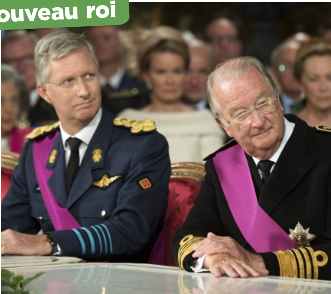
Le nouveau roi, Philippe (à gauche), à côté du roi Albert II, son père, qui a été le souverain des Belges pendant 20 ans.

À l'occasion de cette actualité royale, le JDE propose de retracer l'histoire de la dynastie (famille de rois) belge.