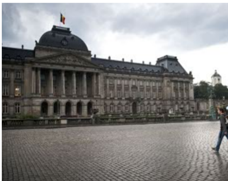
Le palais royal de Bruxelles est l'endroit où le roi travaille et où il traite les affaires de l'État.

Pour exercer sa mission, payer ses collaborateurs, le roi reçoit une somme d'argent de l'État belge. C'est ce que l'on appelle la liste civile. C'est normal que l'État donne de l'argent au roi pour qu'il puisse servir son pays. Le montant annuel de la liste civile est fixé au début du règne du souverain pour toute sa durée. Il ne peut être modifié que par le Parlement. Le montant annuel de la liste civile du roi Philippe a été fixé à 11,55 millions