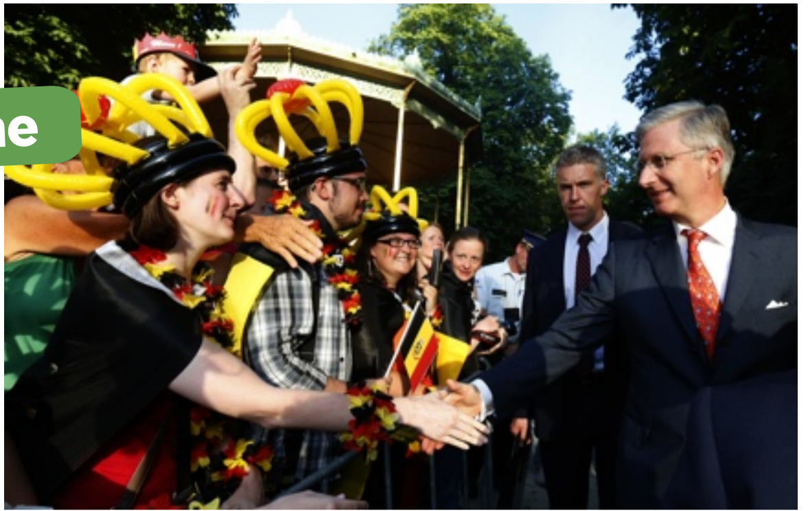
Le 21 juillet 2013, le 7 e roi depuis l'indépendance de la Belgique est monté sur le trône.

L'histoire de la Belgique en tant que pays indépendant ne débute qu'en 1830. Avant, le territoire de notre pays n'a cessé d'être envahi, occupé et dirigé par différents peuples : Espagnols, Français, Autrichiens, Hollandais... Depuis 1815, les provinces belges sont rattachées aux Pays-Bas du Nord (territoire des Hollandais). Belges et Hollandais forment à cette époque le royaume des Pays-Bas, un pays dirigé par le roi Guillaume I er d'Orange. Guillaume d'Orange est un roi autoritaire. Les Belges supportent difficilement le pouvoir hol-