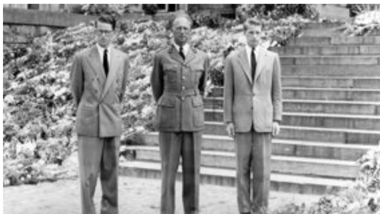
Le roi Léopold III (au centre) entouré de ses fils : le futur roi Baudouin (à gauche) et le futur roi Albert II (à droite).