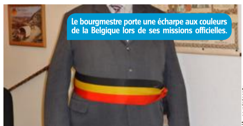
Le bourgmestre porte une écharpe aux couleurs de la Belgique lors de ses missions officielles.

Le candidat bourgmestre est nommé officiellement bourgmestre par le gouvernement régional dont dépend la commune : par le gouvernement flamand pour les communes de la Région flamande et par le gouvernement bruxellois pour les communes de la Région de Bruxelles-Capitale.