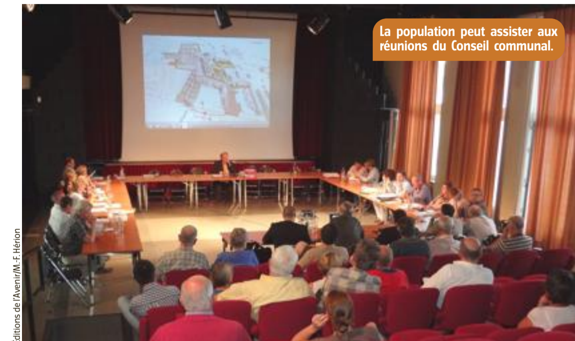
La population peut assister aux réunions du Conseil communal.