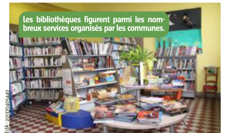
Les bibliothèques figurent parmi les nombreux services organisés par les communes.

Beaucoup de communes organisent un enseignement primaire . Elles dirigent et entretiennent une ou plusieurs écoles communales. La commune offre à ses habitants des possibilités de loisirs : activités sportives (piscines, salles de