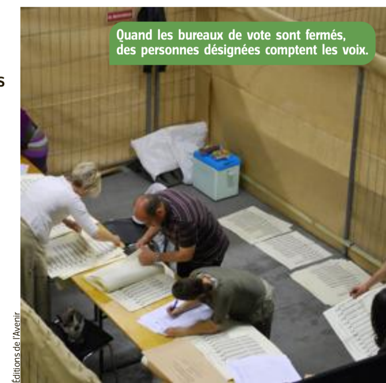
Quand les bureaux de vote sont fermés, des personnes désignées comptent les voix.

Dans chaque commune, des personnes, désignées pour ce rôle parmi les habitants, comptent le nombre de voix (votes) que chaque liste et chaque candidat ont remporté. Sur base de ces chiffres, on fera des calculs pour déterminer qui siégera (fera partie ou sera élu) au Conseil communal. On commence par déterminer