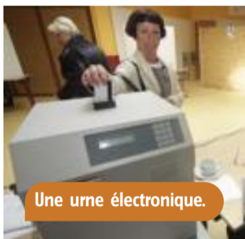
Une urne électronique.