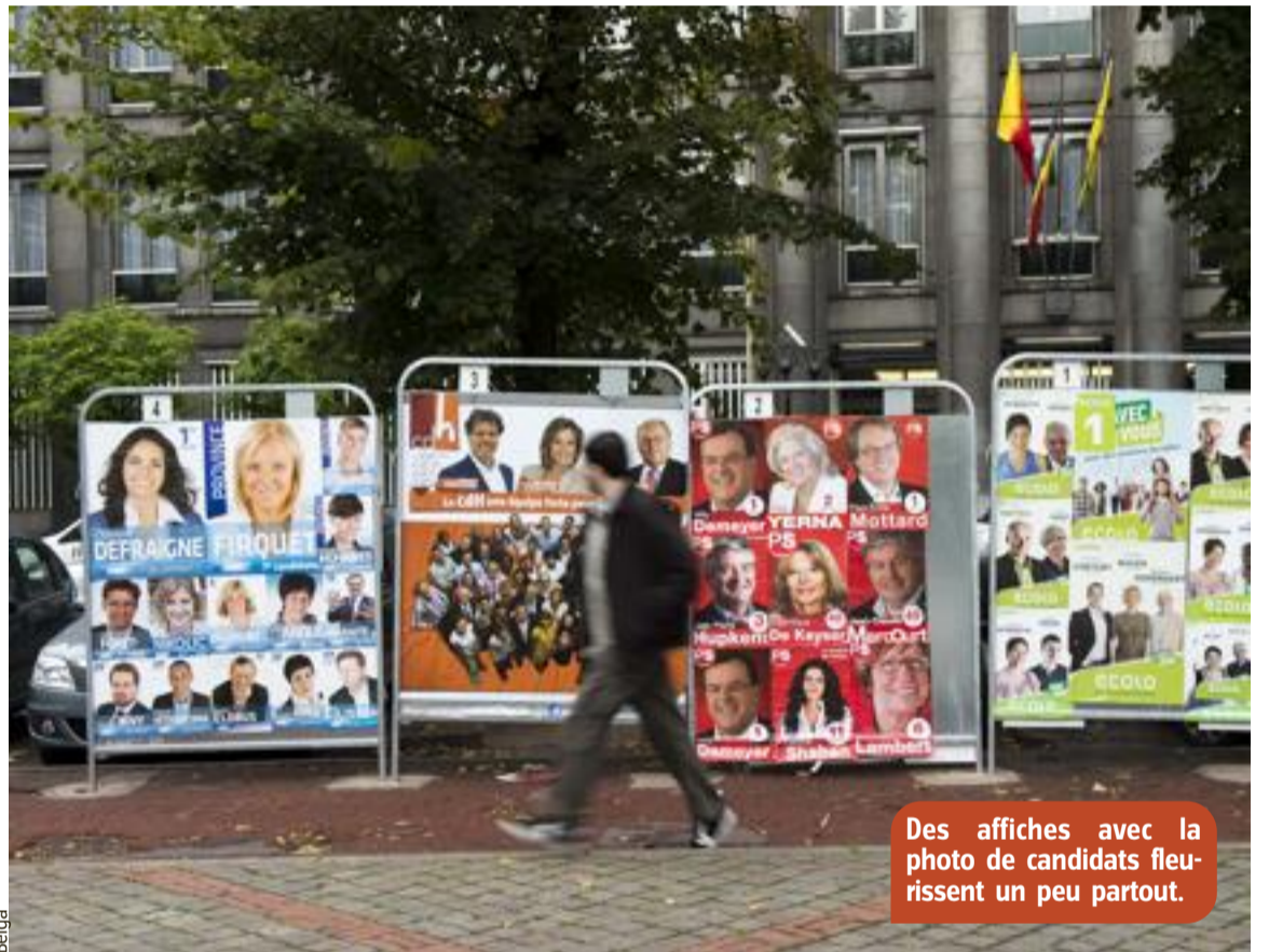
Des affiches avec la photo de candidats fleurissent un peu partout.

Comme tous les pays de l'Union européenne (union de 27 pays européens) et bien d'autres dans le monde, la Belgique est une démocratie, un pays libre. Cela signifie que le pouvoir appartient au peuple. Tout le monde a son mot à dire. La population est régulièrement appelée à voter pour choisir des personnes qui vont la représenter (au niveau du pays tout entier, au niveau des Régions, des communes...). Les personnes élues se réunissent régulièrement en assemblées pour discuter et prendre des décisions pour tous. Le 14 octobre, 7,9 millions de personnes feront entendre leur voix en Belgique.