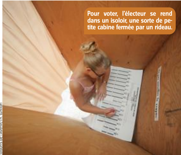
Pour voter, l'électeur se rend dans un isoloir, une sorte de petite cabine fermée par un rideau.