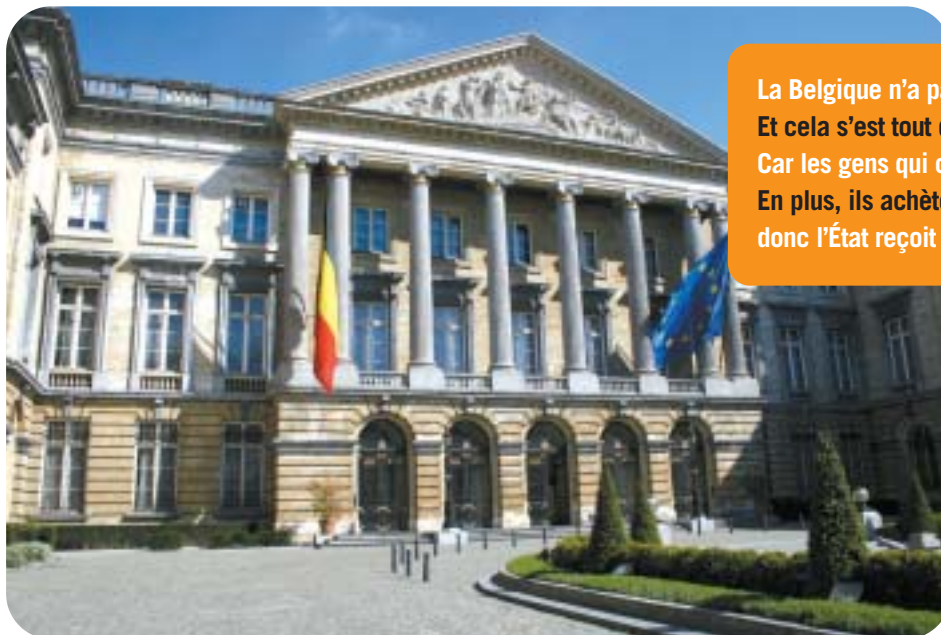
Le budget doit être déposé au Parlement (assemblée qui vote les lois) le deuxième mardi d'octobre afin d'être voté (car les parlementaires doivent donner leur accord en votant) avant la fin de l'année.

Elle peut aller demander à la banque de lui prêter les sous qui lui manquent. Elle demande un crédit (un prêt). La banque prête l'argent pour acheter la maison et la famille peut la rembourser petit à petit. Au lieu de payer 200 000 € en une fois, elle payera 1 000 € tous les mois pendant 20 ans. Si vous avez fait le calcul, vous aurez remarqué que 1 000 € pendant 20 ans, cela fait 240 000 €. Eh bien oui ! La banque ne fait pas cela gratuitement. La famille