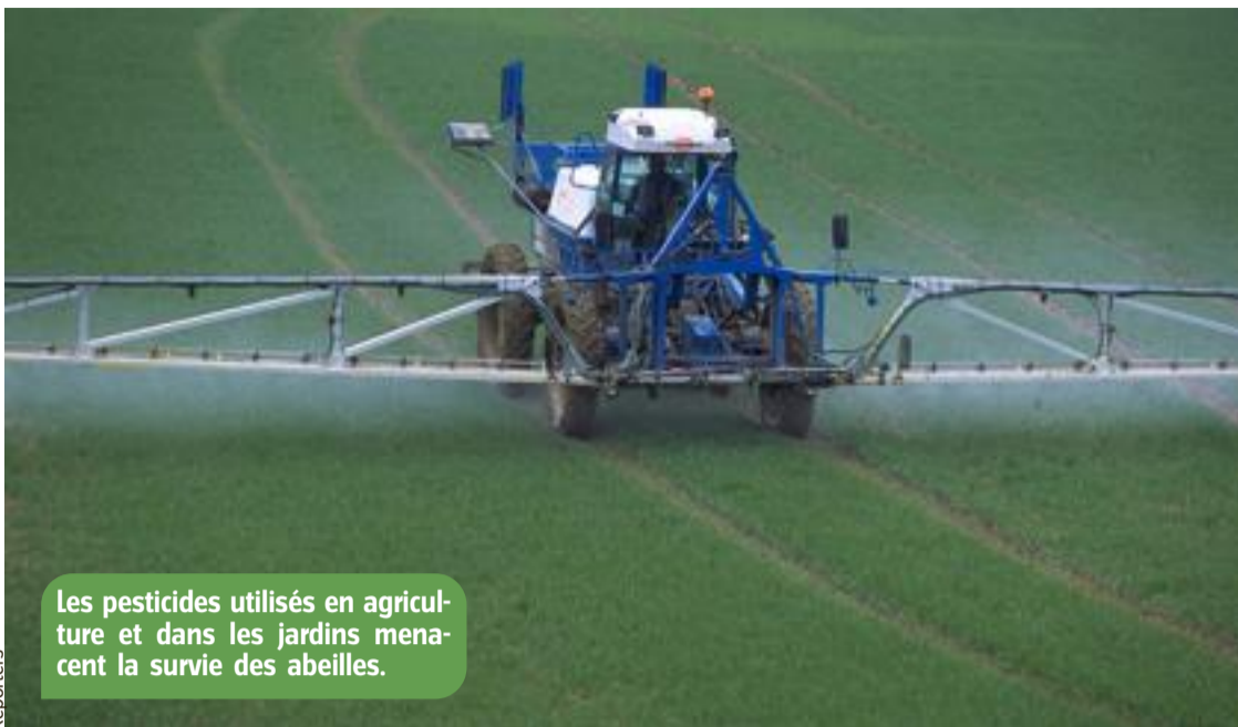
Les pesticides utilisés en agriculture et dans les jardins menacent la survie des abeilles.

Les pesticides (produits chimiques qui servent à lutter contre les mauvaises herbes, les insectes qui attaquent les cultures...) utilisés dans l'agriculture, dans les jardins sont néfastes (mauvais) pour les abeilles. Ces produits ne les tuent pas nécessairement directement mais détruisent des plantes qu'elles butinent. Certains pesticides désorientent les abeilles à tel point qu'elles ne retrouvent plus le chemin de leur ruche. Comme ce sont les butineuses qui sortent et ramènent la nourriture, si elles ne rentrent pas, toute la colonie souffre. La diminution des populations d'abeilles est une catastrophe pour la nature et pour l'agriculture. En butinant de fleur en fleur, les abeilles transportent le pollen et participent à la reproduction des végétaux.