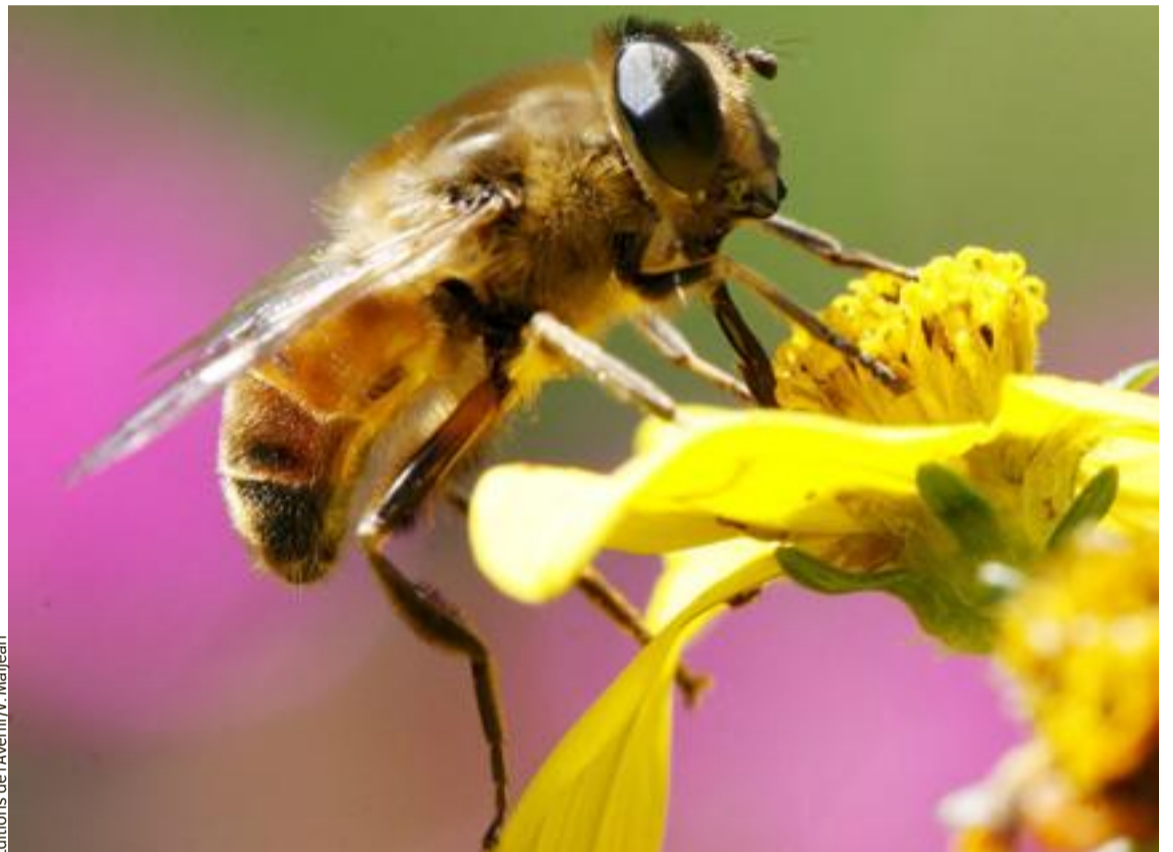
Éditions de l'Avenir/N. Maljean

● Des insectes fascinants Dans ce dossier, le Journal des Enfants vous propose de faire connaissance avec le monde fascinant des abeilles. On vous racontera l'histoire étonnante d'une abeille sauvage qui fait son nid dans des coquilles vides d'escargot. On observera aussi la vie à l'intérieur d'une ruche. Malheureusement, les abeilles sont en danger. Les populations d'abeilles domestiques et sauvages diminuent depuis quelques années. Si ces insectes disparaissaient, ce serait une catastrophe pour l'agriculture (et par conséquent pour notre alimentation) et pour la nature en général. Quand vous aurez lu ce dossier, vous ne verrez plus les abeilles de la même façon. Chiche qu'elles ne vous feront plus peur ?