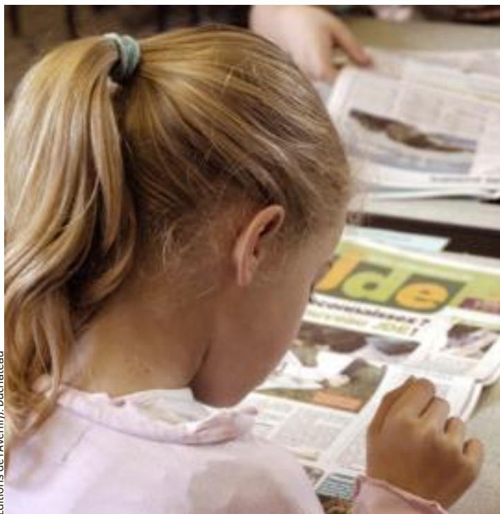
Éditions de l'Avenir/J. Duchateau

mour. C'est particulièrement important dans un journal destiné aux enfants. Il faut traiter les sujets de façon objective mais on attend de ce type de journal qu'il véhicule (fait circuler) des valeurs que l'on voudrait faire passer dans l'éducation d'un enfant. Je pense aux valeurs d'honnêteté, de vérité, de solidarité... Ces valeurs peuvent passer par des témoignages, par les photos. On peut montrer beaucoup de choses à travers la photo. Un journal pour enfants doit montrer que l'on vit dans un monde divers où les gens ne pensent pas tous de la même façon. »